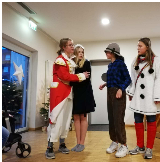
Die Eiskönigin (Szenenbild)

Wie in jedem Jahr hat eine Schülergruppe des Mariengymnasiums in der Vorweihnachtszeit unsere Nachbarn in der Senioren-Residenz Schanze besucht.